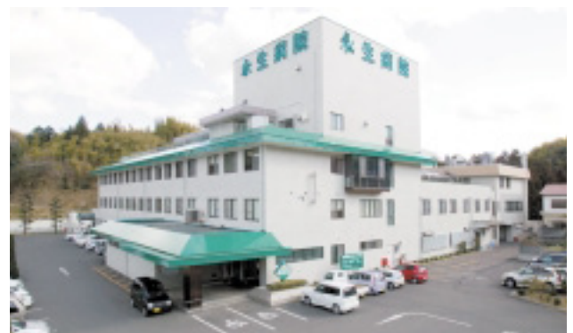
永生病院 130床(一般病棟 40床・療養型病棟 90床)