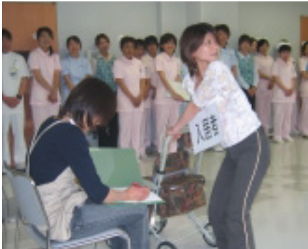
朝礼にて、接遇のロールプレイングを行っています。

患者様に対して気持ちの良い対応ができる様、今後も委員会を中心として改善活動を行っていききたいと思います。