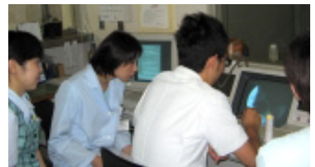
検査の様子を委員会メンバーで評価しています。