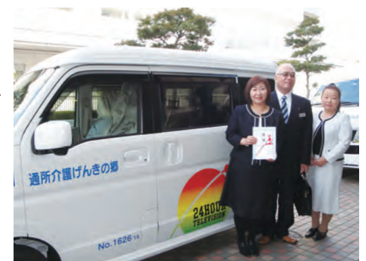
通所介護げんきの郷

街で見かけることはあっても、まさか私達のところにやってきてくれるとは…。本当に皆様の絶え間ないご支援のおかげだと感謝しております。今後も利用者さまが、地域の中で家族や友人・仲間と一緒に、自分の望む自分らしい人生を楽しんでいただけるよう、微力ながら全力でサポートしていきたいと思っております。本当にありがとうございました。大切にに使わせていただきます。