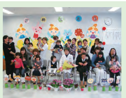
平成28年度 ひまわり託児所修了式